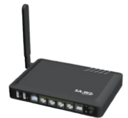
無線LAN付きルーター (レンタルご提供)