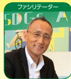
博報堂DYホールディングス CSRグループ推進担当部長