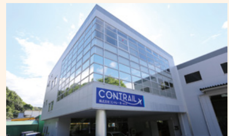
広島市内にある可部工場

今回、複合機を導入いただいたことを機に、マングローブ植林のご報告をすると共に、リコージャパンが取り組むSDGsの活動についてご紹介させていただきました。