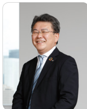
リコージャパン株式会社 代表取締役 社長執行役員 CEO

SDGs（持続可能な開発目標）とは、国連に加盟する193カ国の合意のもと採択された世界共通の目標です。SDGsが目指す「持続可能な社会」を実現するためには、行政をはじめ、企業、教育機関、NPO/NGOなどの各種団体、地域社会、そして各個人に至るまで、すべての人々がそれぞれの立場から取り組んでいかなければなりません。私たちリコージャパンでは、経営の中心に「SDGs」を据えて取り組みを進めています。このコミュニケーションブックを通じて、私たちがどのようにSDGsに取り組んでいるかを知っていただき、皆様と共に2030年のゴールに向けて、活動の輪を拡げていきたいと願っています。