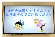
一目で伝わるようなイラストも掲載し、分かりやすくすに配慮しています。(千歳店)