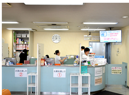
患者様の見やすい位置にモニターを設置しています。(札幌店)