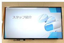
薬剤師をはじめとするスタッフ紹介のコンテンツを展開しています。(千歳店)