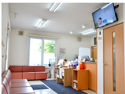
各店舗の患者様層に合わせた情報を配信しています。(千歳店)