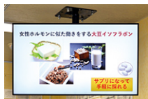
自然と健康意識が高まるような多様な情報を配信しています。(札幌店)