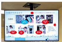
調剤の工程を、写真も入れながら紹介しています。(札幌店)