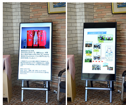
商品情報から焼酎づくりの行程、イベント案内まで、配信情報は多岐に渡ります。