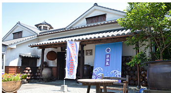
昨年の「新酒まつり」では、「明治蔵」にモニターを移設し、見どころ案内に活用しました。

リコーのデジタルサイネージはクラウド型で、インターネット環境があれば場所を問わず設置できる利点を活用して、「明治蔵」でのイベントに使用しました。芋焼酎の製造期間は8月～12月で、秋になると新酒が続々と登場します。そこで薩摩酒造では毎年10月末に「新酒まつり」を開催しています。昨年の「新酒まつり」では、デジタルサイネージを本社から「明治蔵」へ移動。スムーズな館内案内に活用しました。例年、館内の奥まった場所には人が流れにくかったのですが、入り口に設置したデジタルサイネージで見どころを分かりやすくご案内したところ、物販エリアまでスムーズに誘導することができました。当社では県内外で様々なイベントを行っていますので、「新酒まつり」でのデジタルサイネージ活用を経て、他のイベントでも有効に展開できる可能性を感じています。