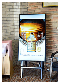
他媒体に掲載した広告をデジタルサイネージでも展開することで情報に触れる機会が倍増します。